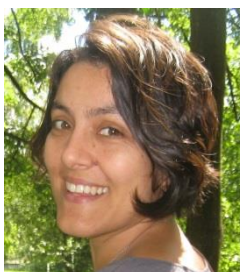
Responsable Com : Céline Doux